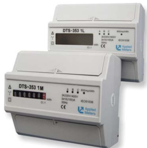
Elektromery DTS-353 1L a DTS-353 1M