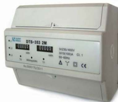
Elektromer DTS-353 2M