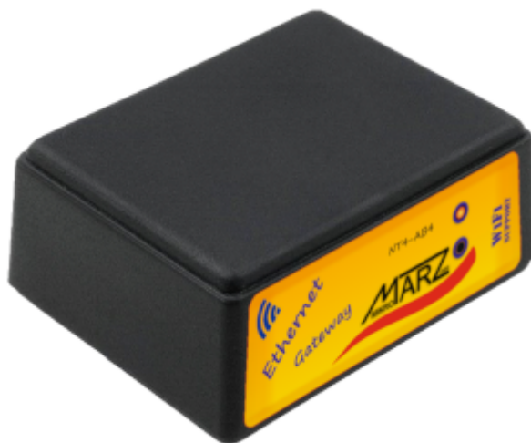
Obr. 1 Ethernetová brána NT4-AB4

Ethernetová brána NT4-AB4 s WiFi / GSM rozšířením je určena pro připojení SensorFor senzorů nebo aktuátorů k libovolnému MQTT serveru dle specifikace v5.0/3.1. Tento způsob propojení umožňuje na jednom místě koncentrovat data ze senzorů a aktuátorů různých výrobců a zprostředkovává přímé propojení mezi nimi za účelem sofistikovaného měření nebo řízení. Ethernetová brána splňuje požadavky specifikace SparkPlug B v1.0, která definuje strukturu přenášených dat a jejich kódování. Uživatel, autonomní jednotka nebo jiný obdobný systém má tímto způsobem přístup k datům svých senzorů nebo k ovládání svých zařízení prostřednictvím MQTT serveru bez nutnosti definovat strukturu a formát dat pro každé zařízení individuálně. Primárním nástrojem pro konfiguraci a diagnostiku brány a připojených periférií je vnitřní webový server.