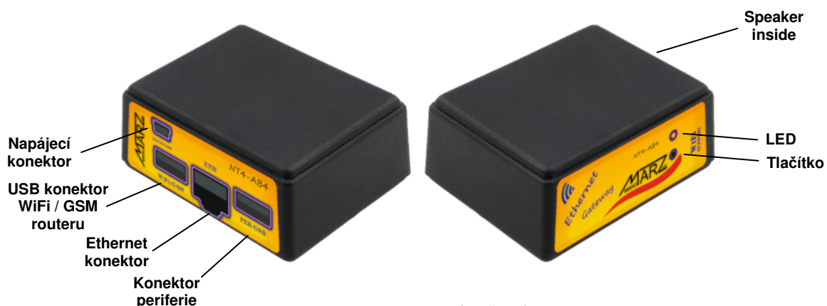
Obr. 2 NT4-AB4, popis zadní a přední strany