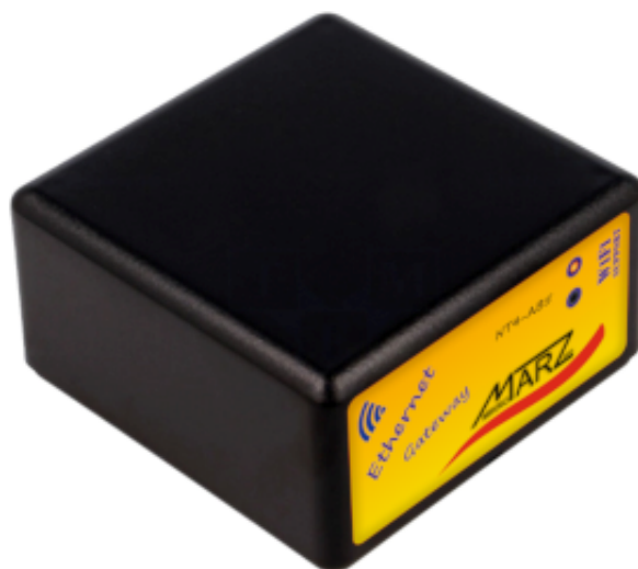
Obr. 1 Ethernetová brána NT4-AB5

Ethernetová brána NT4-AB5 s WiFi / GSM rozšířením a 3-násobným počtem portů je určena pro připojení až čtyř SensorFor senzorů nebo aktuátorů k libovolnému MQTT serveru dle specifikace v5.0/3.1. Tento způsob propojení umožňuje na jednom místě koncentrovat data ze senzorů a aktuátorů různých výrobců a zprostředkovává přímé propojení mezi nimi za účelem sofistikovaného měření nebo řízení. Ethernetová brána splňuje požadavky specifikace SparkPlug B v1.0, která definuje strukturu přenášených dat a jejich kódování. Uživatel, autonomní jednotka nebo jiný obdobný systém má tímto způsobem přístup k datům svých senzorů nebo k ovládání svých zařízení prostřednictvím MQTT serveru bez nutnosti definovat strukturu a formát dat pro každé zařízení individuálně. Primárním nástrojem pro konfiguraci a diagnostiku brány a připojených periférií je vnitřní webový server.