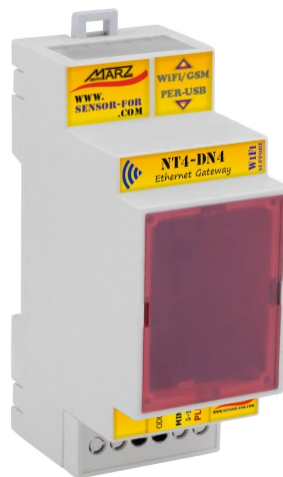
Obr. 1 Ethernetová brána NT4-DN4

Ethernetová brána NT4-DN4 s WiFi / GSM rozšířením je určena pro připojení SensorFor senzorů nebo aktuátorů k libovolnému MQTT serveru dle specifikace v5.0/3.1. Tento způsob propojení umožňuje na jednom místě koncentrovat data ze senzorů a aktuátorů různých výrobců a zprostředkovává přímé propojení mezi nimi za účelem sofistikovaného měření nebo řízení. Ethernetová brána splňuje požadavky specifikace SparkPlug B v1.0, která definuje strukturu přenášených dat a jejich kódování. Uživatel, autonomní jednotka nebo jiný obdobný systém má tímto způsobem přístup k datům svých senzorů nebo k ovládání svých zařízení prostřednictvím MQTT serveru bez nutnosti definovat strukturu a formát dat pro každé zařízení individuálně. Primárním nástrojem pro konfiguraci a diagnostiku brány a připojených periferií je vnitřní webový server.