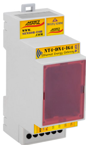
Obr. 1 Ethernetová brána NT4-DN4 s integrátorem impulsů NT3-IG4 nese označení NT4-DN4-IG4

Ethernetová brána NT4-DN4 s WiFi / GSM rozšířením je určena pro připojení SensorFor senzorů nebo aktuátorů k libovolnému MQTT serveru dle specifikace v5.0/3.1. Tento způsob propojení umožňuje na jednom místě koncentrovat data ze senzorů a aktuátorů různých výrobců a zprostředkovává přímé propojení mezi nimi za účelem sofistikovaného měření nebo řízení. Ethernetová brána splňuje požadavky specifikace SparkPlug B v1.0, která definuje strukturu přenášených dat a jejich kódování. Uživatel, autonomní jednotka nebo jiný obdobný systém má tímto způsobem přístup k datům svých senzorů nebo k ovládání svých zařízení prostřednictvím MQTT serveru bez nutnosti definovat strukturu a formát dat pro každé zařízení individuálně. Primárním nástrojem pro konfiguraci a diagnostiku brány a připojených periférií je vnitřní webový server. Brána NT4-DN4-IG4 v sobě již obsahuje zabudovaný modul 3-kanálového 2-tarifního integrátoru impulsů NT3-IG4 .