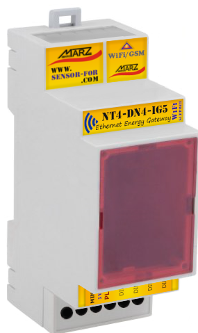
Obr. 1 Ethernetová brána NT4-DN4 s integrátorem impulsů NT3-IG5 nese označení NT4-DN4-IG5

Ethernetová brána NT4-DN4 s WiFi / GSM rozšířením je určena pro připojení SensorFor senzorů nebo aktuátorů k libovolnému MQTT serveru dle specifikace v5.0/3.1. Tento způsob propojení umožňuje na jednom místě koncentrovat data ze senzorů a aktuátorů různých výrobců a zprostředkovává přímé propojení mezi nimi za účelem sofistikovaného měření nebo řízení. Ethernetová brána splňuje požadavky specifikace SparkPlug B v1.0, která definuje strukturu přenášených dat a jejich kódování. Uživatel, autonomní jednotka nebo jiný obdobný systém má tímto způsobem přístup k datům svých senzorů nebo k ovládání svých zařízení prostřednictvím MQTT serveru bez nutnosti definovat strukturu a formát dat pro každé zařízení individuálně. Primárním nástrojem pro konfiguraci a diagnostiku brány a připojených periférií je vnitřní webový server. Brána NT4-DN4-IG5 v sobě již obsahuje zabudovaný modul 4-kanálového integrátoru impulsů NT3-IG5 .