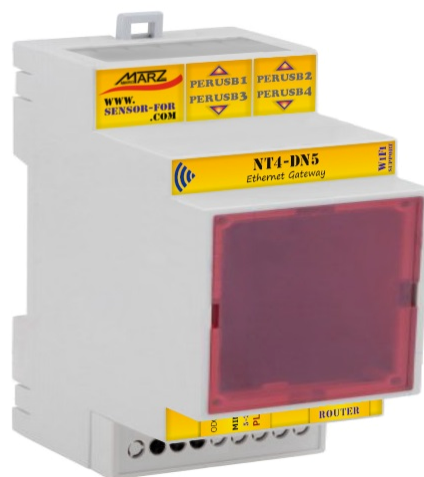
Obr. 1 Ethernetová brána NT4-DN5

Ethernetová brána NT4-DN5 s WiFi / GSM rozšířením a 4-násobným počtem portů je určena pro připojení až čtyř SensorFor senzorů nebo aktuátorů k libovolnému MQTT serveru dle specifikace v5.0/3.1. Tento způsob propojení umožňuje na jednom místě koncentrovat data ze senzorů a aktuátorů různých výrobců a zprostředkovává přímé propojení mezi nimi za účelem sofistikovaného měření nebo řízení. Ethernetová brána splňuje požadavky specifikace SparkPlug B v1.0, která definuje strukturu přenášených dat a jejich kódování. Uživatel, autonomní jednotka nebo jiný obdobný systém má tímto způsobem přístup k datům svých senzorů nebo k ovládání svých zařízení prostřednictvím MQTT serveru bez nutnosti definovat strukturu a formát dat pro každé zařízení individuálně. Primárním nástrojem pro konfiguraci a diagnostiku brány a připojených periférií je vnitřní webový server.