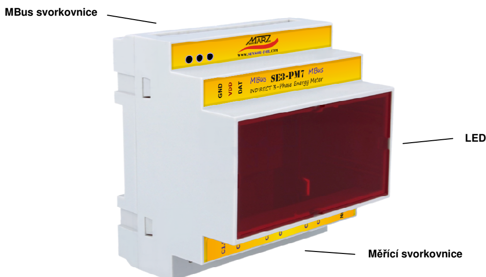
Obr. 2 Popis MBus elektroměru SE3-PM7