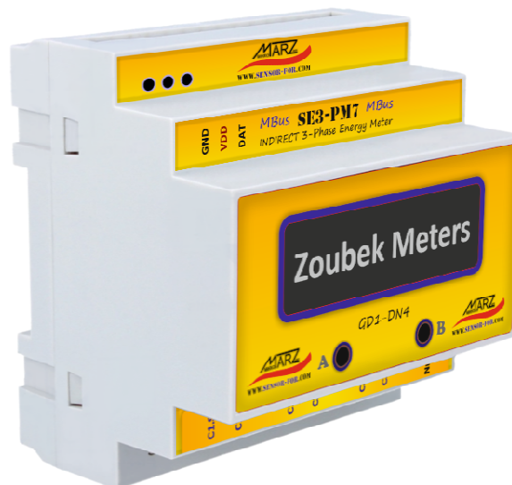
Obr. 1 MBus 3-fázový elektroměr SE3-PM7-LCD pro nepřímé měření

MBus 3-fázový elektroměr SE3-PM7-LCD s proudovými vstupy pro miniaturní měřicí transformátory je sofistikovanější nástupce impulsních elektroměrů s řadou výhod. Jediný impulsní vodič využívaný jedním impulsním elektroměrem lze použít jako datový vodič pro až 12 MBus elektroměrů bez nutnosti jakékoliv konfigurace takto vytvořené sběrnice. Přenos dat je zabezpečený kontrolním součtem CRC16, tzn. je zde zpětná vazba mezi vysílanými a přijatými informacemi. Přenášena je vždy absolutní hodnota veličiny, nadřazený systém si nemusí pamatovat předchozí stav. Nehrozí tedy jakákoliv ztráta dat. Ať již chybou přenosové linky, výpadku nadřazeného systému nebo chybou uživatele. Společně s měřenou veličinou je přenášeno i identifikační číslo elektroměru a kvalitativní parametry měření. Tzn. není možné mezi sebou zaměnit 2 různé elektroměry nebo bez povšimnutí používat elektroměr poškozený. Elektroměr je vybaven LED indikací stavu měření a dokáže indikovat i chybové stavy během instalace a provozu.