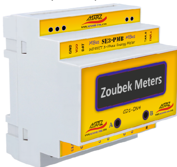
Obr. 1 MBus 3-fázový 2-tarifní elektroměr SE3-PMB-LCD pro nepřímé měření

MBus 3-fázový 2-tarifní elektroměr SE3-PMB-LCD s proudovými vstupy pro malé klešťové měřicí transformátory je sofistikovanější nástupce impulsních elektroměrů s řadou výhod. Jediný impulsní vodič využívaný jedním impulsním elektroměrem lze použít jako datový vodič pro až 12 MBus elektroměrů bez nutnosti jakékoliv konfigurace takto vytvořené sběrnice. Přenos dat je zabezpečený kontrolním součtem CRC16, tzn. je zde zpětná vazba mezi vysílanými a přijatými informacemi. Přenášena je vždy absolutní hodnota veličiny, nadřazený systém si nemusí pamatovat předchozí stav. Nehrozí tedy jakákoliv ztráta dat. Ať již chybou přenosové linky, výpadku nadřazeného systému nebo chybou uživatele. Společně s měřenou veličinou je přenášeno i identifikační číslo elektroměru a kvalitativní parametry měření. Tzn. není možné mezi sebou zaměnit 2 různé elektroměry nebo bez povšimnutí používat elektroměr poškozený. Elektroměr je vybaven LED indikací stavu měření a dokáže indikovat i chybové stavy během instalace a provozu.